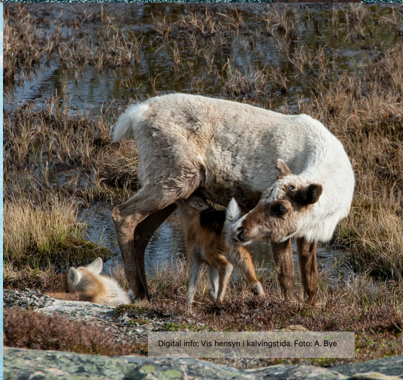
Digitalt info; Vis hensyn i kalvingstida.