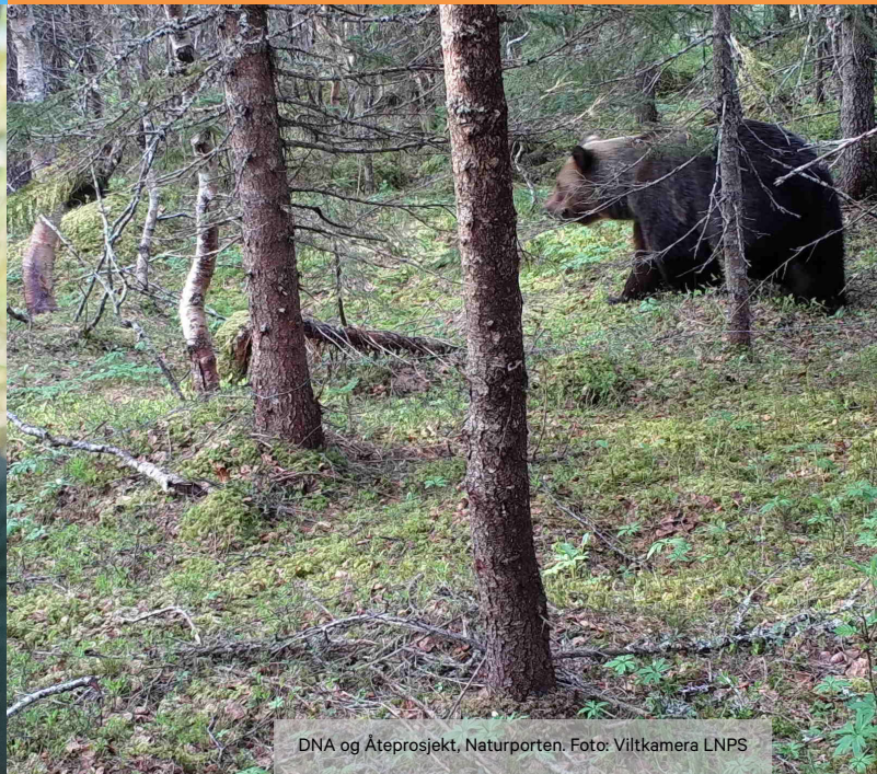
DNA og Åteprosjekt, Naturporten.