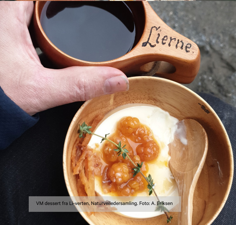
VM dessert fra Li-verten, Naturveiledersamling.