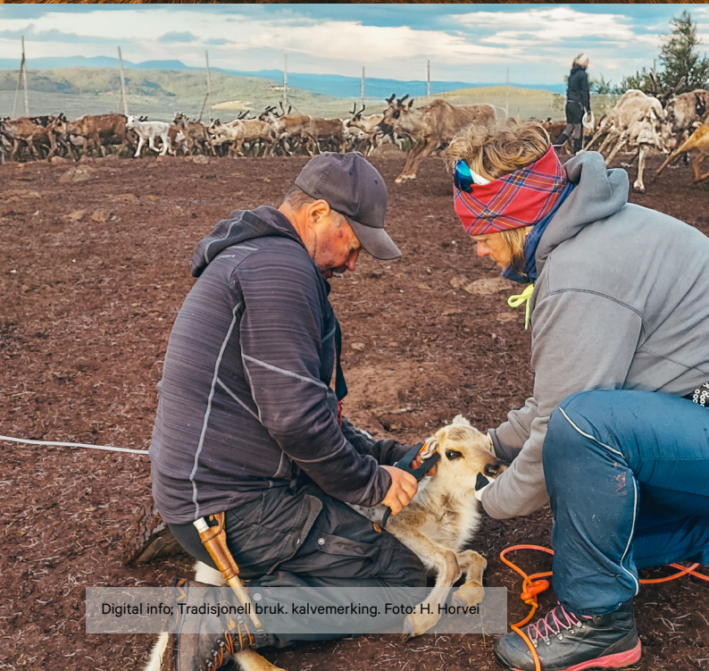
Digital info; Tradisjonell bruk, kalvemerking.

Besøksenteret har mål om å tilby aktiviteter til flere aldersgrupper blant barn og unge. I den forbindelse er det laget et aktivitetshäfte om rovdyr i norsk natur, i samarbeid med Statsforvalteren i Trøndelag.