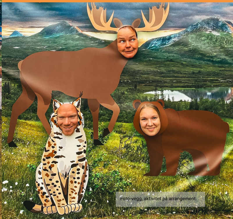
Foto-vegg, aktivitet på arrangement