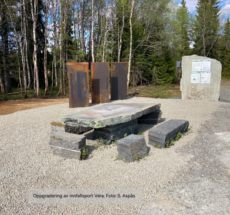
Oppgradering av innfallsport Vera.