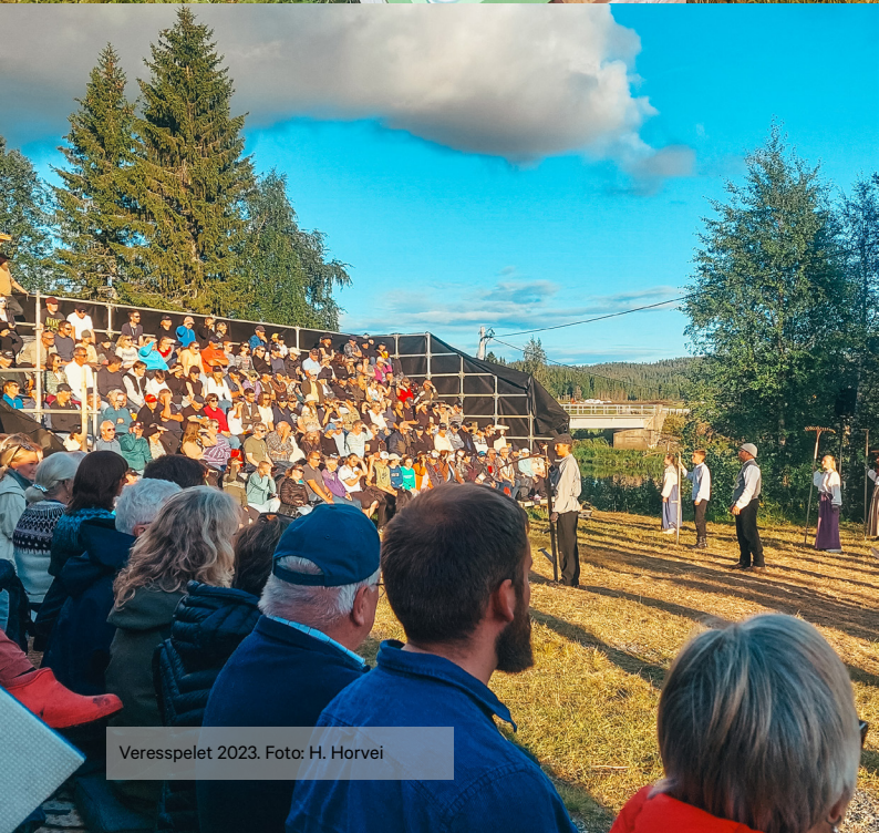
Veresspelet 2023.