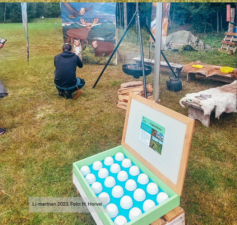
Li-martnan 2023.

Disse arrangementene er gjennomført i randsonen av nasjonalparkene, sammen med gode samarbeidspartnere.