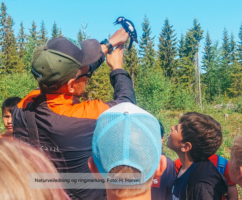
Naturveiledning og ringmerking.

I 2023 arrangerte Besøksenteret naturveiledersamling for naturveiledere ved autoriserte besøksenter i Norge. Totalt deltok 29 personer fra 20 ulike besøksenter.