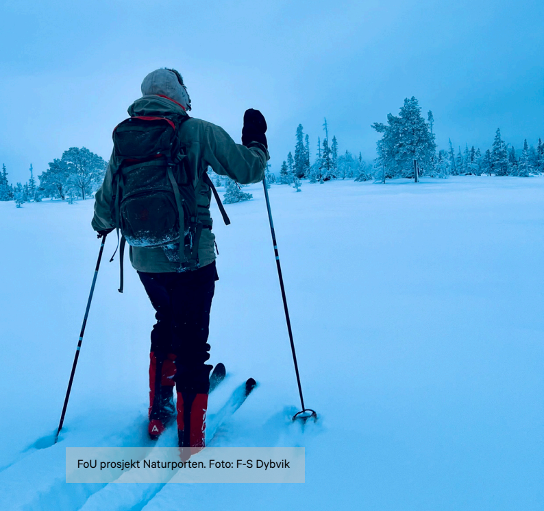
FoU prosjekt Naturporten.