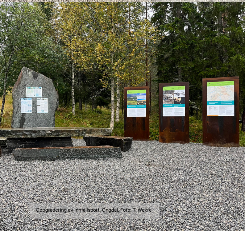
Oppgradering av innfallsport. Ongdal.

Med utgangspunkt i partnerskapsavtalen med Nasjonalparkstyret, er det gjennomført flere prosjekt basert på besøksstrategiene. Oppgradering av innfallsportene iht. Miljødirektoratets designmanual har vært en av kjerneoppdragene. Videre ivaretar Besøkssenteret digitalt formidlingsarbeid for Nasjonalparkforvaltningen.