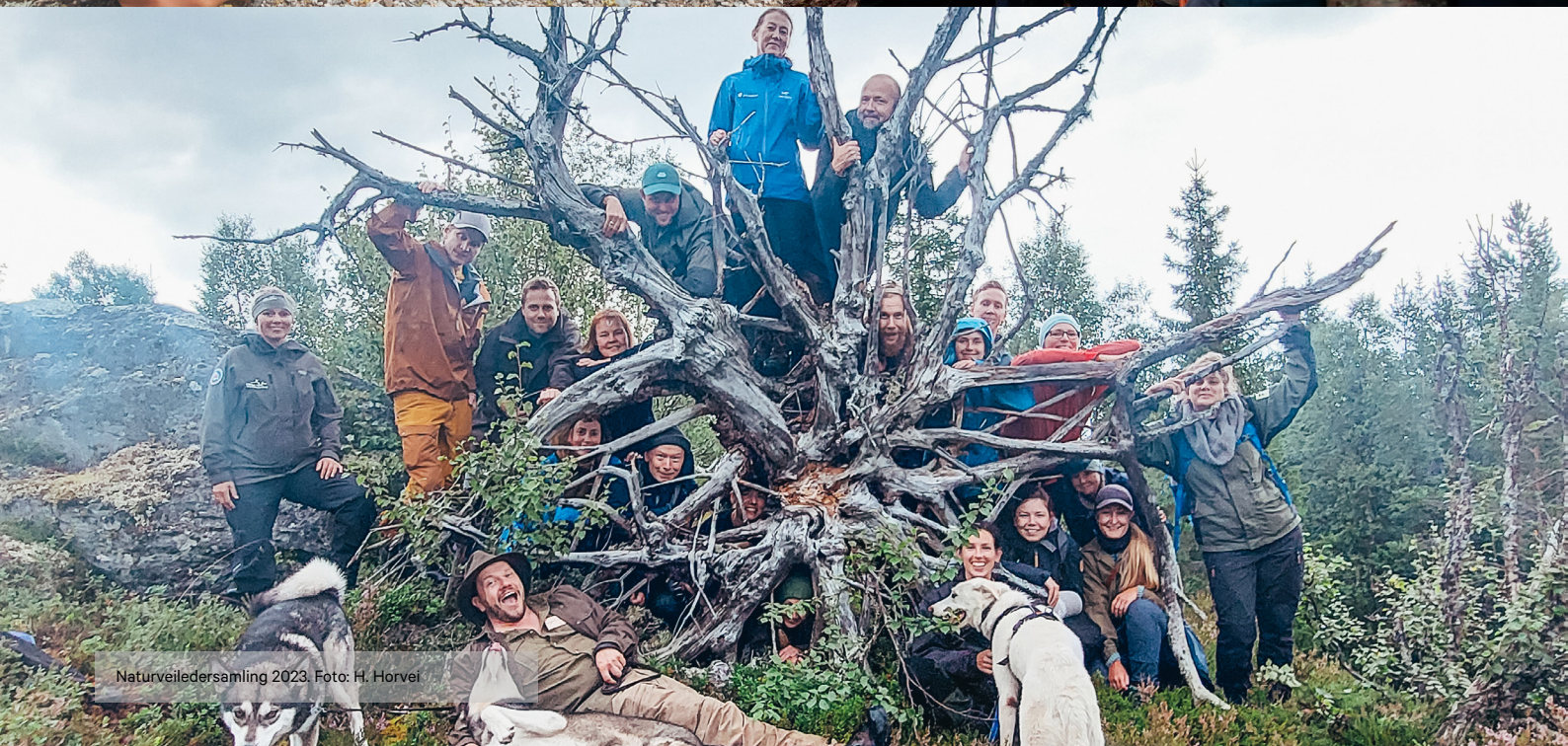
Naturveiledersamling 2023.