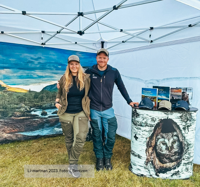
Li-martnan 2023.