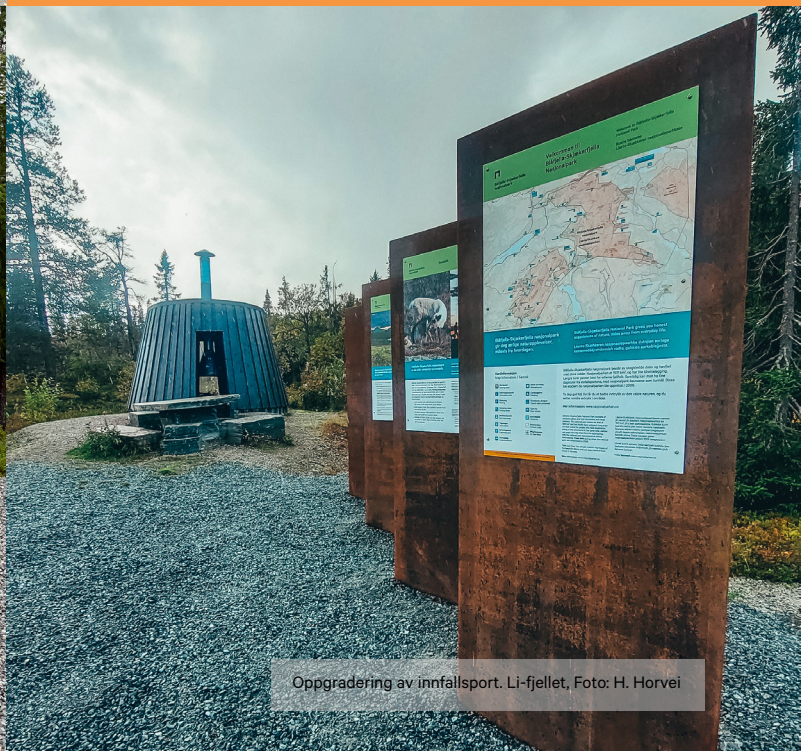
Oppgradering av innfallsport. Li-fjellet.