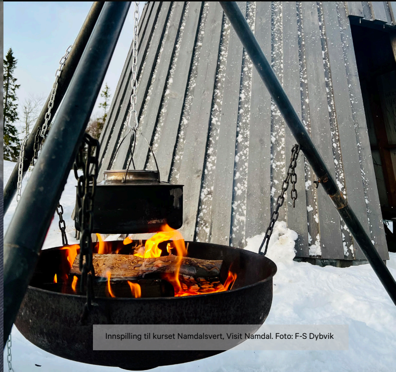
Innspilling til kurset Namdalsvert, Visit Namdal.