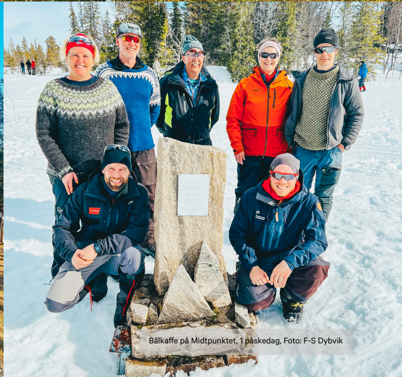
Bålkaffe på Midtpunktet, 1 påskedag