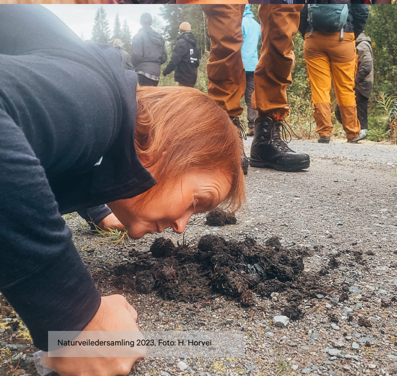
Naturveiledersamling 2023.