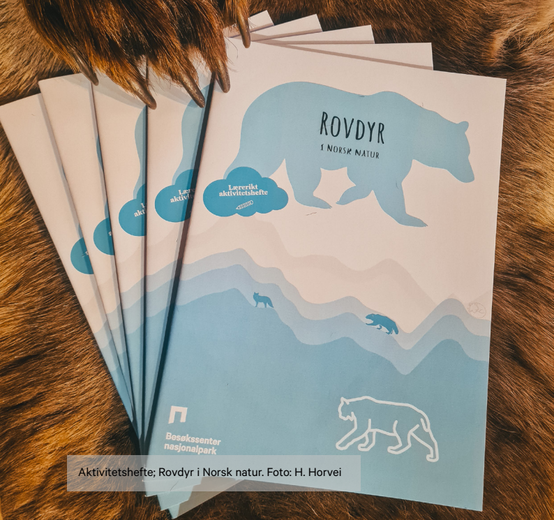
Aktivitetshäfte; Rovdyr i Norsk natur.